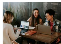
了解就業前景及市場