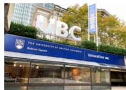
實地視察各區院校